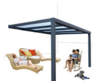
Antraciet grijs structuurlak