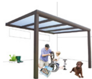
Sepia bruin structuurlak