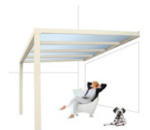
Gebroken wit gladlak